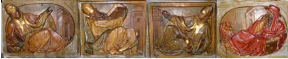
Decoración del banco del retablo mayor San Gregorio Magno, San Agustín, San Ambrosio y San Jerónimo

El banco se decora con los relieves de los Santos Padres e la Iglesia de Occidente (San Gregorio Magno, San Agustín, San Ambrosio y San Jerónimo), encima, en el cuerpo principal, cuatro columnas jónicas enmarcan un ACRO donde se sitúa el sagrario, pieza muy notable del s. XVII. En el ático se ha dispuesto la imagen de San Andrés (s.XVII). Sobre el sagrario se colocó la imagen de San Esteban vestido de diácono con un libro abierto donde aparecen las piedras en referencia a su martirio, por lo que también lleva una palma en su otra mano.