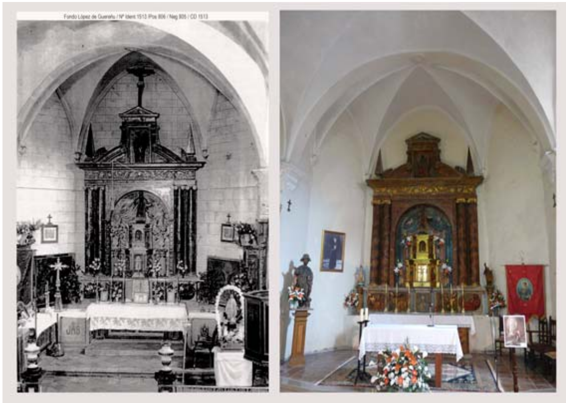
AYER...y ...HOY :Vista comparativa del retablo mayor...

El retablo mayor conserva el sagrario del retablo de la anterior iglesia, realizado en el año 1632. Sobre el mismo figura una imagen de San Esteban, titular del templo parroquial.