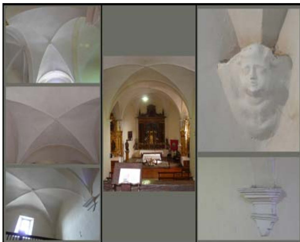
Detalle de las bóvedas de la Iglesia de Hijona (Sacristía, Coro, Planta...

La planta presenta forma de cruz latina con brazos de crucero muy cortos, y se organiza en cabecera y nave de dos tramos. La Cabecera es poco destacada en planta, y se cubre mediante bóveda de arista que se apea en cuatro cabezas de ángeles. En el resto de la iglesia se han empleado también bóvedas de arista salvo en las capillas laterales donde las bóvedas son de lunetos.